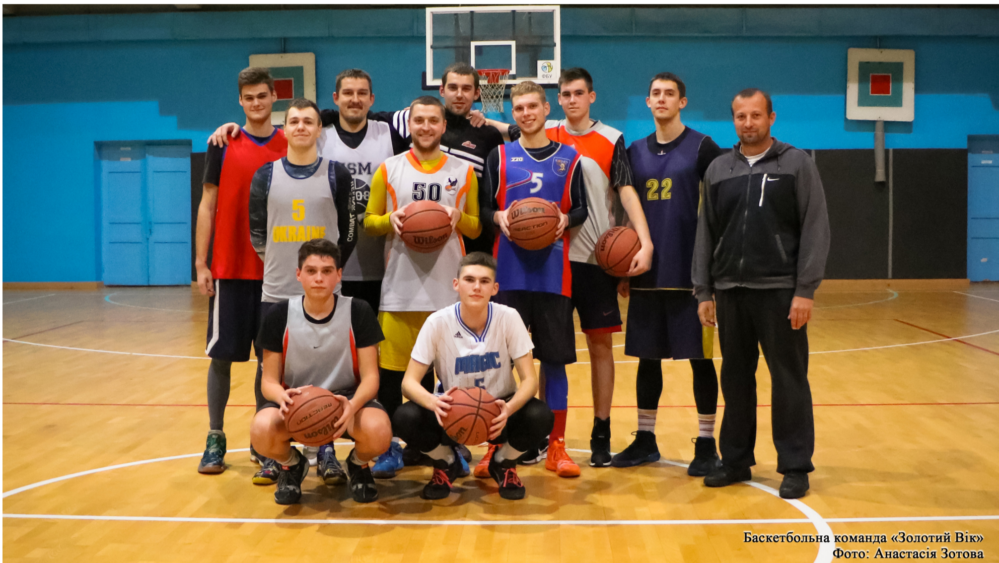
Баскетбольна команда «Золотий Вік»