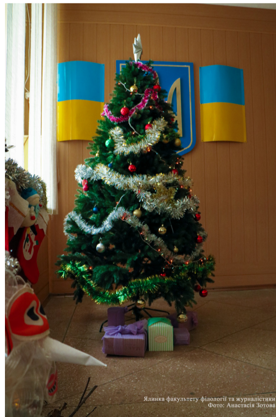
Ялинка факультету філології та журналістики

Природничо-географічний факультет щороку влаштовує справжню експедицію для студентів. Географи можуть прикрасити будь-яку ялинку на вулиці. На цьому факультеті вже