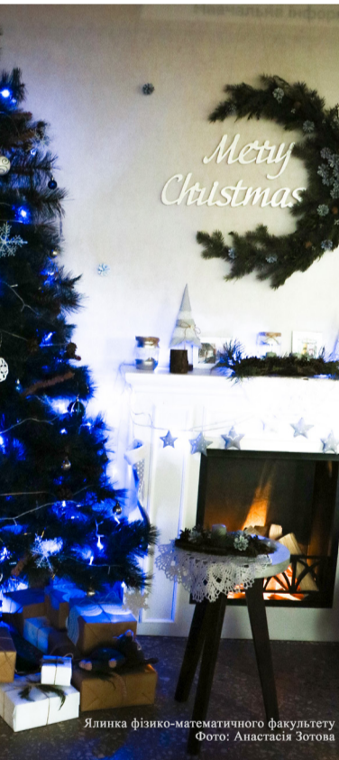
Ялинка фізико-математичного факультету

На факультеті педагогіки та психології цього року пускали до новорічної локації лише після того, як студенти готували святковий сценарій для малля, та проходили кастинг на роль Снігурочки чи Діда Мороза. Ялинка була прикрашена різними поробками нейтральних кольорів. А замість