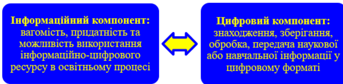
Рис. 2. Компоненти цифрових ресурсів

Саме інтегрована реалізація цих компонент (інформаційний ↔ цифровий) в освітньому процесі ефективна за середовищного підходу в епоху техногенно-інформаційного суспільства.