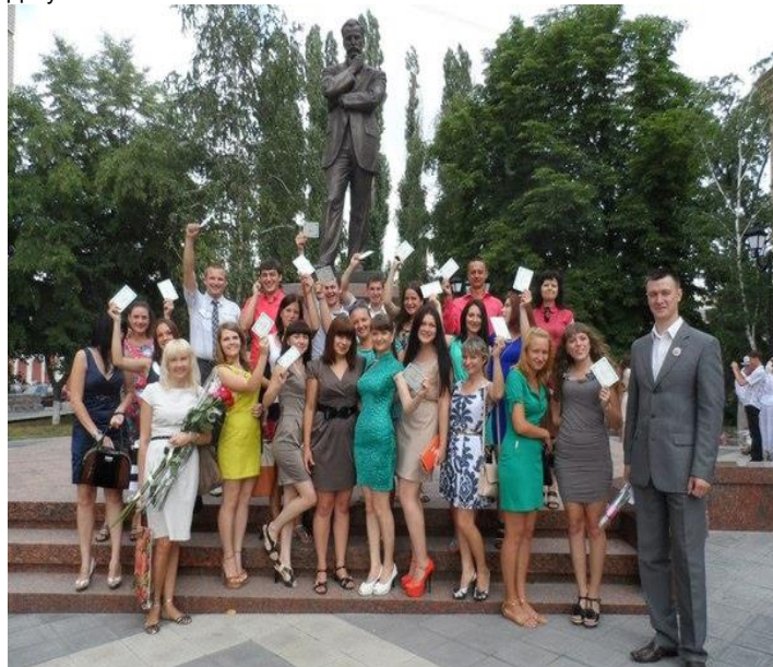
3 повагою, студенти 53 групи!

Земний уклін Вам за натхненну працю, за Ваше вміння долати життєві труднощі, за Ваше причастя мудрості й добра! Дякуємо Вам.