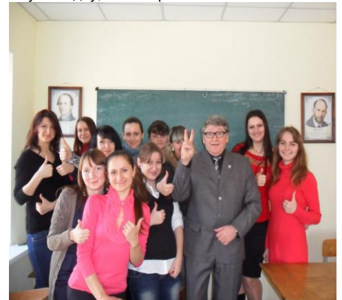
З повагою, студенти 55 групи !

Ваші знання і мудрість, просту й водночас таку складну, ми збережемо на все життя.