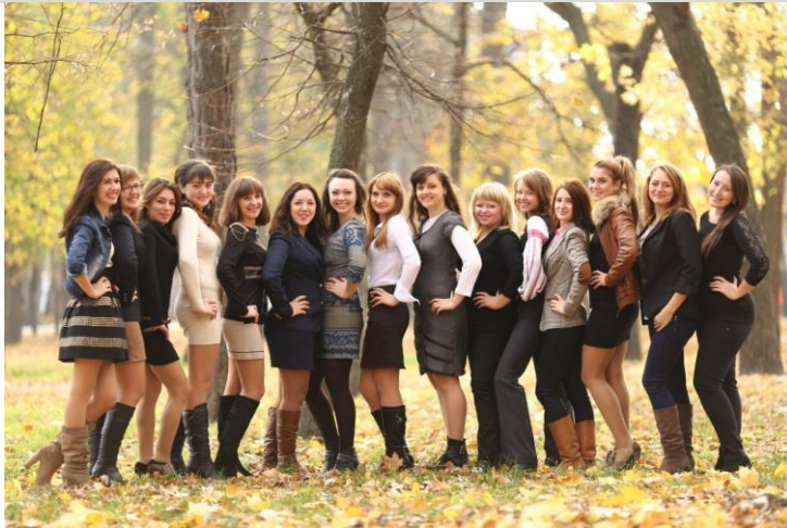
3 повагою, студенти 51 групи!!!

Прошло п'ять літ, а наче лише вчора ми познайомились з студентством боязливо, взяли ви нас - вели по коридорах доводячи, що тут навчатись особливо... І крок за кроком ми все сподівались Що Ви для нас відкриєте життя Судента-практика, студента-меломана, А вивідразу дали нам знання І по крупинці слів збирали мудрість І з келихом любові повним до країв, пробачте нам оту миттєву дурість, коли на модульних вмикали шахраїв.... "Життя бентежне" – Ви нам говорили "Списати не дамо і не просить" "Ви справедливості у світі не шукайте, а будьте самі мудримі завжди" Та все ж " сказати мусим, Ми вдячні за знання, за силу волі, Якою вміло виділили з мас За ті акорди, що такі зіграли На струнах серця кожного із нас!