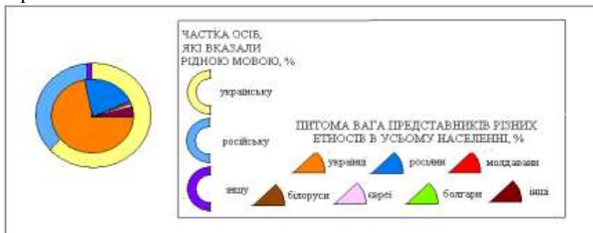
Рис. 1. Зразок оформлення секторної діаграми етномовного складу населення.

Завдання 1. На основі таблиці 1. (Додаток 1.) побудувати секторні діаграми етнічного та мовного складу населення (рис 1.) України, Кіровоградської та сусідніх до неї областей у 2001 р. Здійснити письмовий аналіз побудованих діаграм та зробити висновки про основні тенденції в динаміці етномовного складу населення зазначених територій. За даними таблиці 1. Порівняти дані про етномовний склад населення запропонованих територій у 2001 р. з даними за 1979 р. та 1989 р.