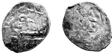
Монета – знахідка 2 з контрмаркою.

Перша монета – генуезько-татарська, про що свідчать кілька збережених латинських літер легенди, східна дротова техніка карбування і вага. На лицьовій стороні монети можна бачити дві контрмарки. Праворуч – велика, із квадратним відбитком штемпеля, розміром – 9 на 9 мм., контрмарка "Колюмни", типу – центральний промінь, поміщений на п'єдестал, з чотирма опуклими крапками між центральним і правим променем знака. Лівий промінь "Колюмни" забитий другою контрмаркою. Її приблизні розміри – 8 на 8 мм. Характер зображення не зовсім чіткий через нахил чекана, у результаті чого частина зображення не прокарбувалася. Можливо це т.зв. "генуезький портал", алеймовірноше це тамга хана Бату. Монета після контрмаркування майже не була в обігу, тому що на контрмарках не видно слідів зносу.