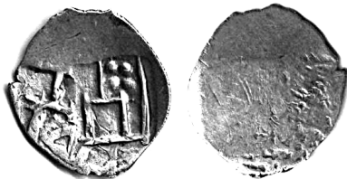
Монета – знахідка 1 з подвійною контрмаркою.

Монети з литовськими контрмарками "Колюмни", що трапляються серед знайдених у скарбах монетах, які оберталися на території півдня України в XIV – XV ст., на сьогодні ще недостатньо вивчені. Дотепер предметом дискусії є емітент, призначення, та час і місце виникнення контрмаркування [1, 56 – 60; 80 – 84]. Насамперед це пояснюється великою рідкістю монет з контрмарками. Тому великий інтерес становлять знахідки подібних монет, що дають змогу додати нову інформацію до цієї теми.