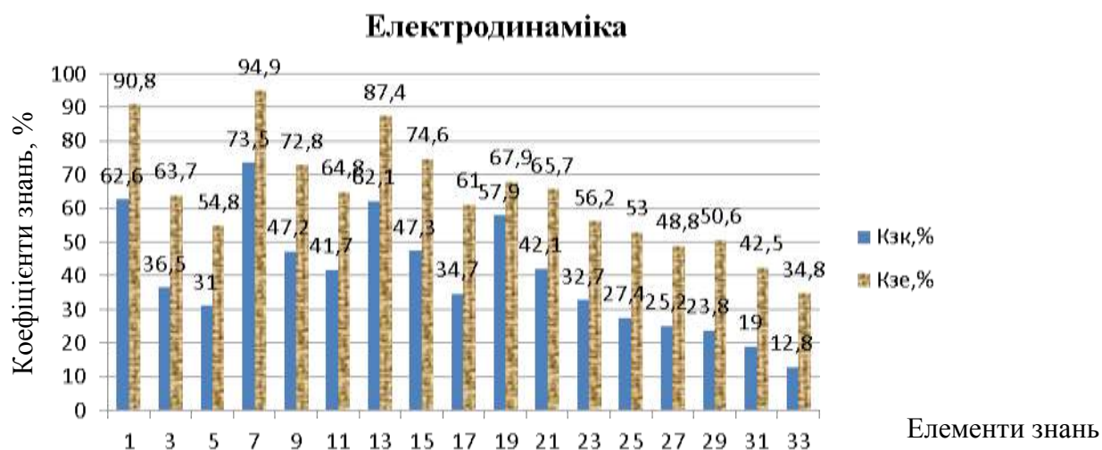
Рис. 2. Вибіркова гістограма знань учнів з фізики в педагогічному експерименті

Статистична обробка результатів педагогічного експерименту здійснювалася з використанням критерію Стьюдента.