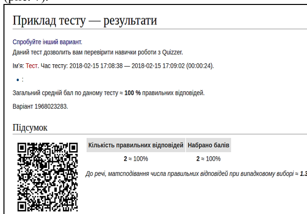
Рис. 6. Вікі-сторінка із результатом тестування

EasyTests має спеціальну адміністративну сторінку, що у вигляді таблиці відображає список пройдених користувачами тестів із зазначенням варіанту, назви тесту, тривалості проходження тесту, кількості набраних балів та кількості правильних відповідей (рис. 7).