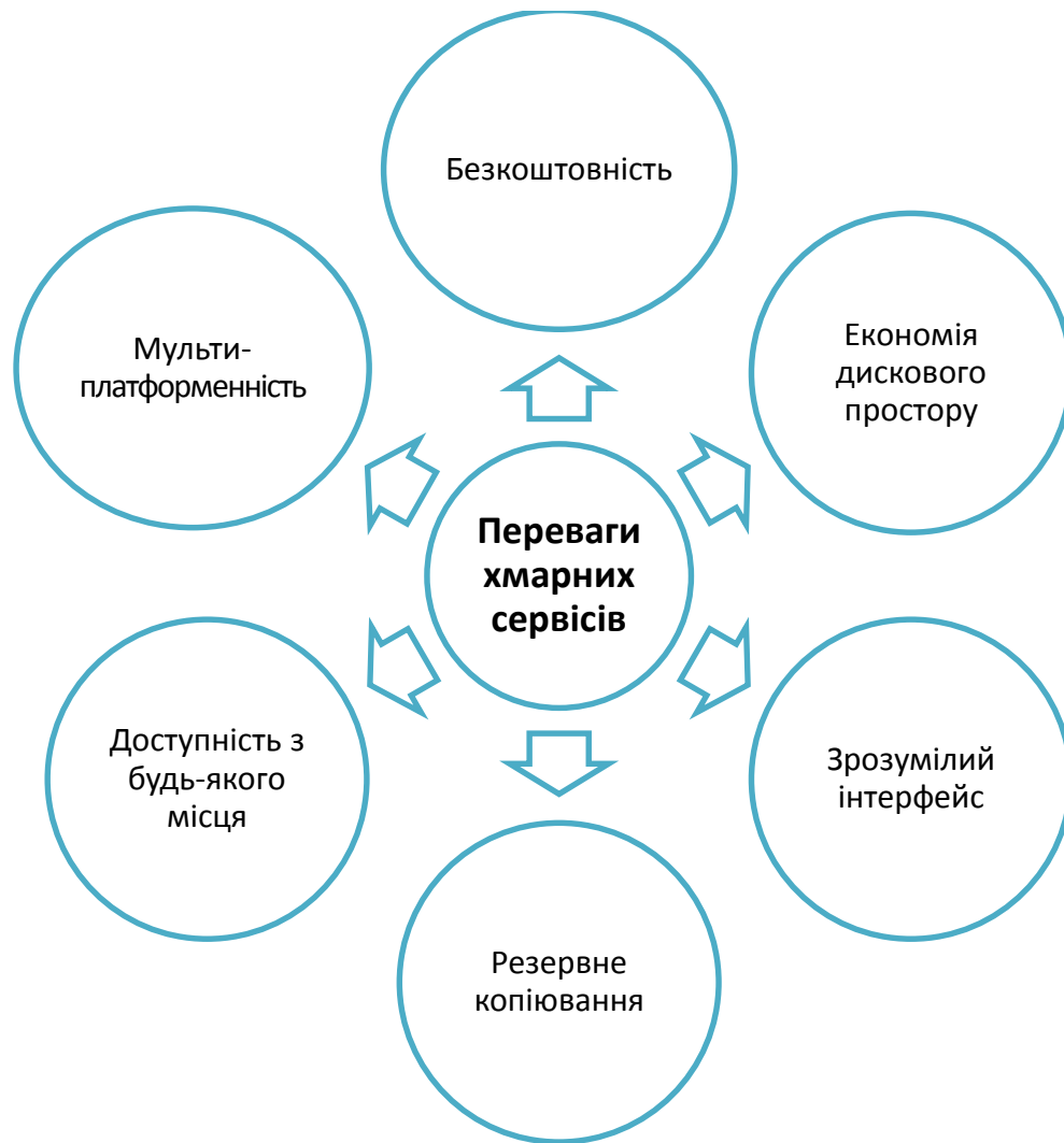
Рис. 2. Переваги використання хмарних сервісів

Для розміщення відео-матеріалів вчителем є спеціальний сервіс YouTube. Завантаживши відео на сервіс, вчителю потрібно лише надати учням адресу відео-матеріалу для перегляду.