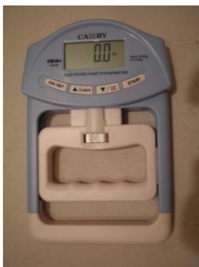
Рис. 1. Плоскопружинний медичний динамометр.

Динамометрія найсильнішої руки в середньому складає 65-80 % маси тіла в чоловіків і 48-50 % у жінок.