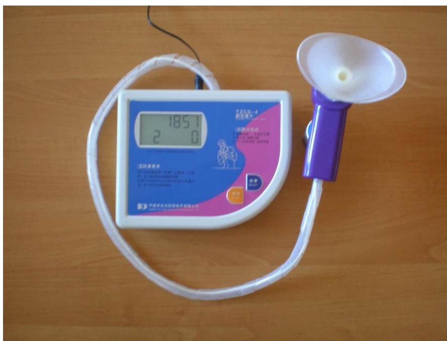
Рис. 2. Спірометр сухий, портативний.

Порядок виконання роботи наступний. На початку дослідження шкалу сухого портативного спірометра поворотом виставляють на "0". Потім випробуваний, зробивши найбільш глибокий вдих, робить у спірометр глибокий видих, після чого зчитують показання за шкалою приладу. Дослідження проводять двічі - на початку і кінці заняття.