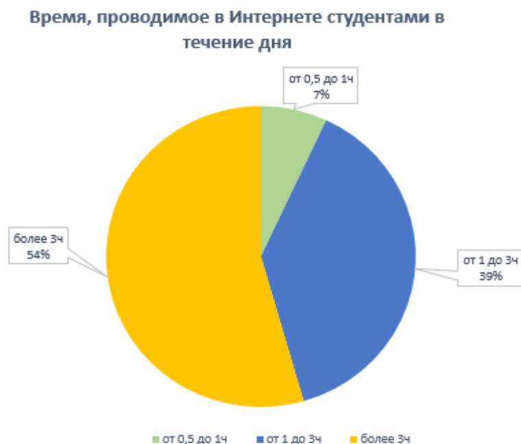
Рис. 1. Время, проводимое в Интернете студентами в течение дня

Полученные данные совпадают с данными предоставленными аналитическим агентством We Are Social и крупнейшей SMM-платформой Hootsuite, которые отмечают, что сегодняшний среднестатистический интернет-пользователь проводит в сети около 6 часов в день [5].