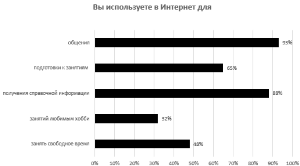
Рис. 2. Цель использования сети Интернет

Среди опрашиваемых, ответы на третий вопрос «знакомо ли Вам понятие «облачные вычисления» («облачные технологии»)»?» показал, что большинство 62% респондентов оперируют этим понятием.