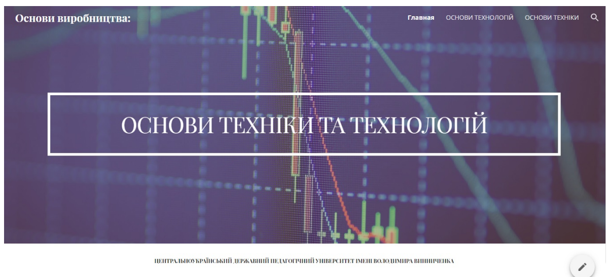
Рис. 2. Скриншот сторінки створеного сайту в Google Sites «Основи техніки та технологій»

Зважаючи на високу популярність серед українських користувачів та широкі можливості Google , пропонуємо скористатися даним сервісом при організації навчального процесу ЗВО. На базі доступних програмних продуктів Google можна створити конкретні електронні навчальні курси. Наприклад, нами було розроблено навчальний сайт Google Sites New (рис. 2) та створено вільний