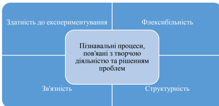
Рис. 2. Сукупність характеристик мислення, що визначають МОС

усвідомлювати й рефлексувати мисленнєвий процес, уявлення про психічні функції (рис. 2).