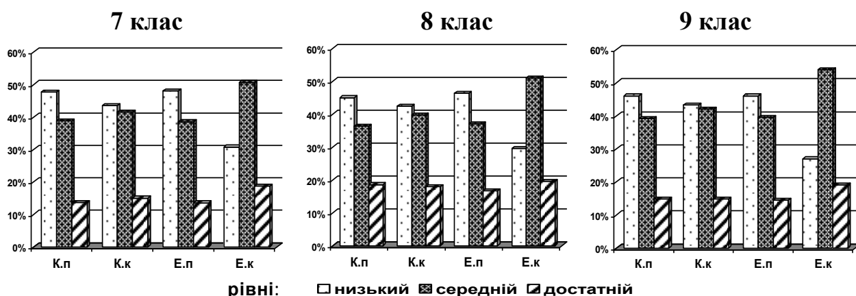
Рис. 2. Розподіли учнів експериментальних (Е) і контрольних (К) груп за рівнями сформованості ЕК на початку (п) і в кінці (к) експерименту (у % від загальної кількості)

рівнями сформованості ЕК на початку і в кінці експерименту представлені на рис. 2.