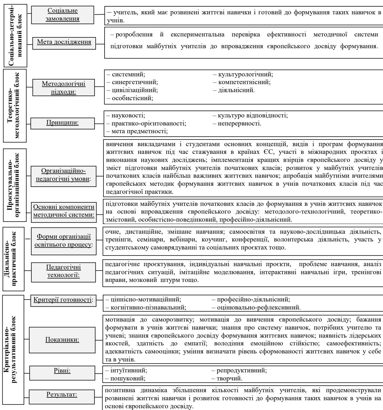
Рис. 2. Структурно-функціональна модель методичної системи імплементації європейського досвіду формування в учнів життєвих навичок у професійну підготовку майбутніх учителів початкових класів України

педагогічних технологій. Це представлено в структурно-функціональній моделі (рис. 2).