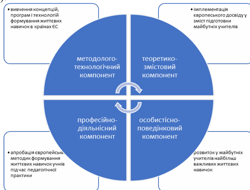
Рис. 3. Циклічний взаємозв'язок між основними компонентами методичної системи підготовки майбутніх учителів початкових класів до формування в учнів життєвих навичок на основі впровадження європейського досвіду

Отже, між компонентами та організаційно-педагогічними умовами реалізації методичної системи підготовки майбутніх учителів початкових класів до формування в учнів життєвих навичок на основі впровадження європейського досвіду прослідковується циклічний зв'язок: забезпечення першого компоненту за допомогою першої організаційно-педагогічної умови ставало передумовою для забезпечення другого компоненту на основі реалізації другої організаційно-педагогічної умови і так доти, доки забезпечення четвертого компоненту ставало передумовою для активізації першого, оскільки під час педагогічної практики виникали нові проблеми, нові запитання і нові потреби у вивченні європейського досвіду (рис. 3).