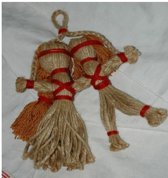
Експозиції Державного музею дитячої іграшки, м. Київ.