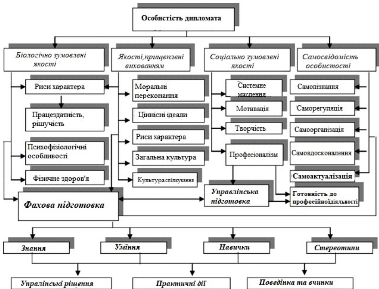
Рис. 1. Модель особистості дипломата

Модель дипломата виступає як сукупність знань і якостей, які відображають державні й суспільні вимоги до нього не лише як до професіонала, але й як до особистості, суб'єкта суспільних відносин (рис. 1).