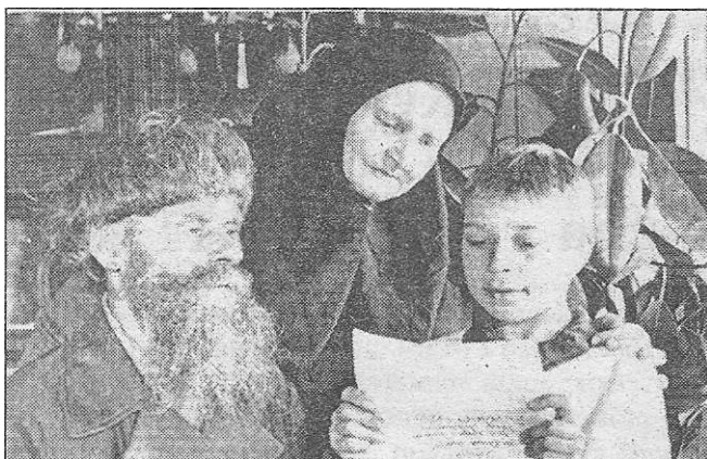
0 За читанням листа з фронту. 1944 р.

2-й ведучий. Скільки крові віддано дітям, скільки було пролито на трудовому фронті поту!