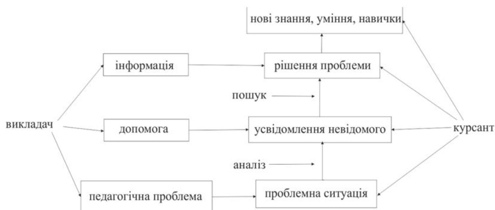
Рис. 1. Схема реалізації проблемної технології навчання

Проблемна ситуація спонукає виникнення у майбутніх пілотів пізнавальної потреби розгляду факту, явища, процесу з точки зору знань з психолого-педагогічних дисциплін.