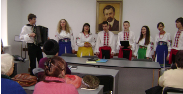
Мистецький факультет виступає перед слухачами Академії з колядками.

Академія ветеранів учить, що рятує людину не лише фізичне здоров'я, а й духовне. Дуже важливо для людини мати бадьорий дух, настрої. Але духовність – це не лише бадьорість. Це – головним чином – високі моральні цінності, честь, гідність, повага до інших, відчуття свободи. Тому-то останнім часом населення звертає свої погляди до того світу, в якому панує верховенство права, що гарантує захист честі, гідності й свободи людини. Важливе місце у формуванні передової свідомості слухачів Академії зайняв спецкурс з музичної тематики про відомих композиторів та їхні твори, який прочитала професор Г. С. Дідич.