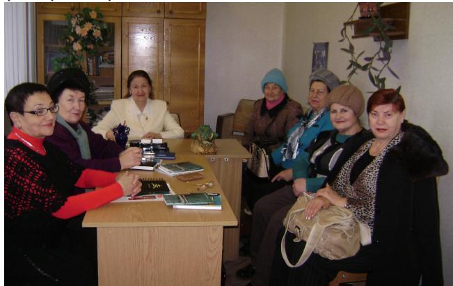
Слухачі Академії під час індивідуального заняття.

Доля Академії ветеранів складається щасливо ще й тому, що вона працює в найінтелектуальнішому закладі міста й при великій підтримці ректорату, профкому і всього колективу. Заняття Академії проводяться в найпрестижніших приміщеннях університету.