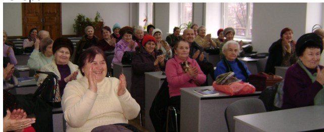
Слухачі Академії на зханняттях.

Наша Академія має ще одну дуже важливу властивість – вона збирає навколо себе справді добрих людей. В ній навчаються ті, хто усвідомив, що найціннішим багатством є доброта. Саме доброта робить життя людини цікавішим. І слухачі та викладачі академії прийшли до оптимістичного висновку, що добрі люди живуть довше. Злість, ненависть, заздрість, жадібність – це антиподи довгого щасливого життя. В складні часи сучасного етапу життя країни і вузу ентузіасти університету втілюють в життя безсмертні ідеї славетного земляка В.О. Сухомлинського. Можна стверджувати, що Академія ветеранів досягає своєї мети – морально підтримувати ветеранів війни та праці, пропагувати здоровий спосіб життя й зміцнювати здоров'я наших ветеранів.